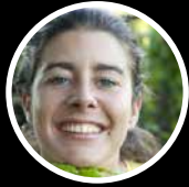
Daisy Directora Envol Vert