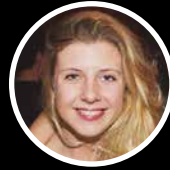
Charlotte Coordinadoras Bogota